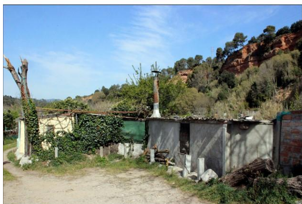
Al Prat Vell