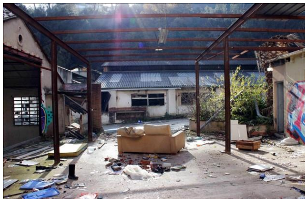
Molí d'en Galí