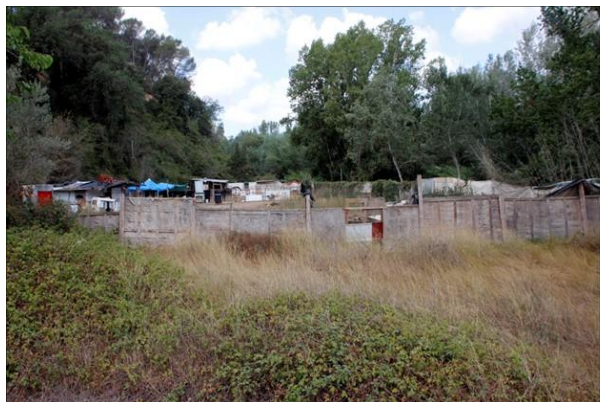
Al Molí d'en Galí