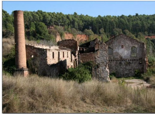
Moli d'en Font