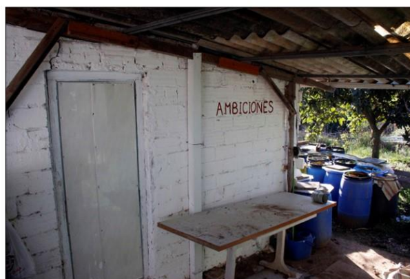
Al Molí de l'Amat