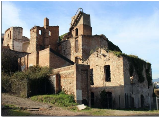
Moli d'en Torrella