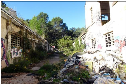
Moli d'en Galí