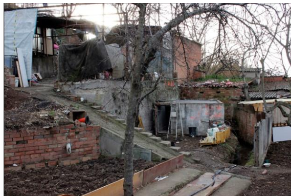
A l'Horta Romeu