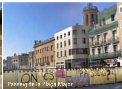
Passeig de la Plaça Major