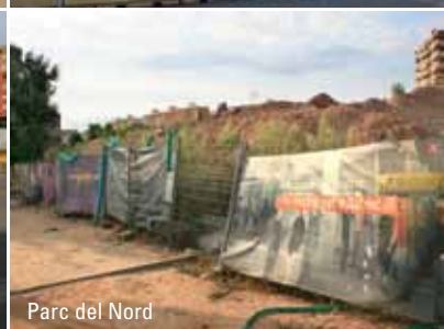
Parc del Nord

Finalment, a començament de febrer, es va confirmar que la Generalitat aturava les obres del perllongament dels FGC a Sabadell. No podem dir que l'anunci ens agafés a contrapeu, perquè ja feia mesos que veníem denunciant que des de l'estiu únicament funcionava la tuneladora; la novetat va ser que el propi conseller de Política Territorial en fes l'anunci formal. Un anunci que situava la represa de les obres cap al mes de setembre, afirmació que no té cap mena de credibilitat perquè no es basa en cap planificació o estudi de viabilitat.