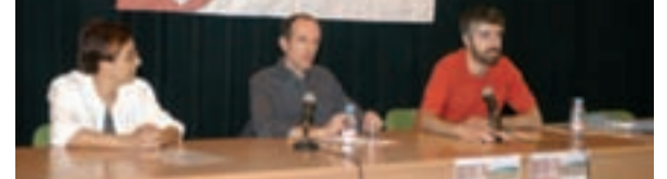
La Via Verda i la proposta de Parc Agrícola del Vallès