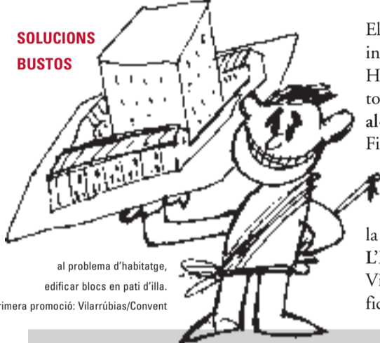
al problema d'habitatge, edificar blocs en pati d'illa. primera promoció: Vilarrúbias/Convent

El juny del 2004, el Ple municipal va aprovar un projecte que permetia edificar 4.000 m 2 al pati interior d'illa qualificat com a No Edificable entre els carrers de Vilarrúbias, Convent, Sant Honorat i Soledat. Aquest despropòsit va rebre el suport de tots els partits representats al consistori, tret de l'Entesa. Els veïns i les veïnes afectats i l'Entesa van ser els únics que van presentar al·legacions en el període d'exposició pública.