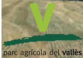
parc agrícola del vallès